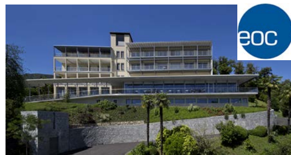
Clinica di Riabilitazione EOC Sede di Novaggio