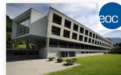
Clinica di Riabilitazione EOC Sede di Faido